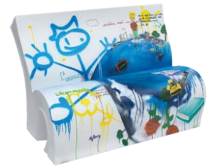
Antoine de Saint-Exupéry Le Petit Prince