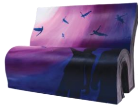
Bernard Werber Les Thanatonautes