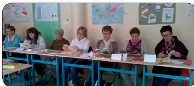
Formations pour les bénévoles à Saint-Affrique

« Je peux m'appuyer sur ce type de formation pour éviter d'être mis en difficulté face à des groupes de préados. Cette formation devrait me permettre de mieux aborder les préadolescents ». Yves