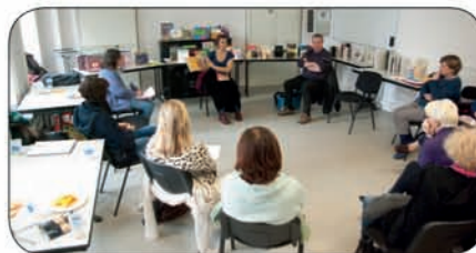
Formation dans le Nord

oeuvre plusieurs axes de travail : une augmentation des conventions signées avec des crèches, la mise en place d'une formation pour les parents d'une école maternelle, l'intégration des parents dans le projet « Lecture » d'un accueil de loisirs, la mise en place de deux journées de formation à destination des bénévoles intervenant auprès des enfants âgés de 0 à 3 ans.