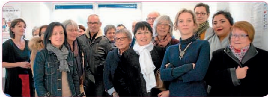
Les participants à la formation « Lecture aux primo-arrivants »

Comme d'autres départements, les Côtes d'Armor accueillent de nombreux mineurs étrangers isolés scolarisés dans les collèges et lycées, et qui ont besoin d'un accompagnement spécifique. Lire et faire lire 22 s'est engagé auprès de ces jeunes afin de les aider dans l'acquisition du français. Mercredi 18 janvier à Saint-Brieuc, les bénévoles se sont réunis pour la formation « Lecture aux primo-arrivants ».