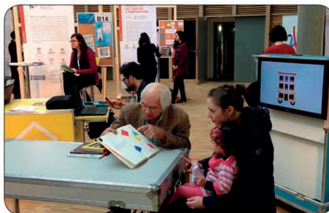
Lectures proposées tout le week-end aux familles présentes

Le week-end des 14 et 15 janvier 2017, Lire et faire lire était présent au forum La France s'engage afin de présenter le projet Temps-Livres aux visiteurs du forum ainsi qu'aux 91 autres lauréats et 54 finalistes La France s'engage.