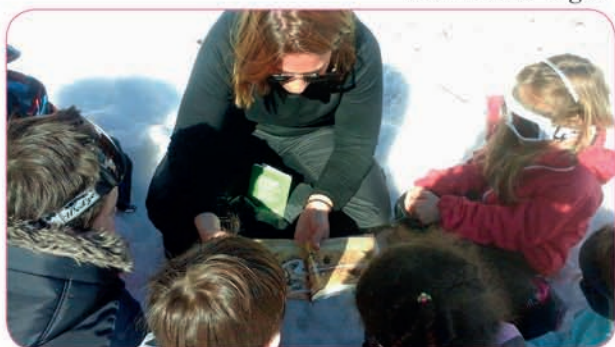
Lectures avec les livres de « Sacs de Pages » et de « Je lis la science »